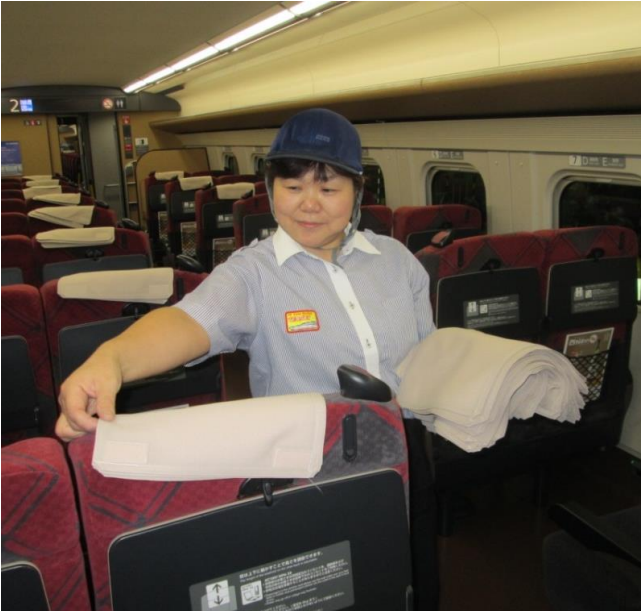
座席枕カバーの交換作業

★小山サービスセンターでは夜間、新幹線車両基地にてJR東日本の新幹線の清掃作業を行っています。