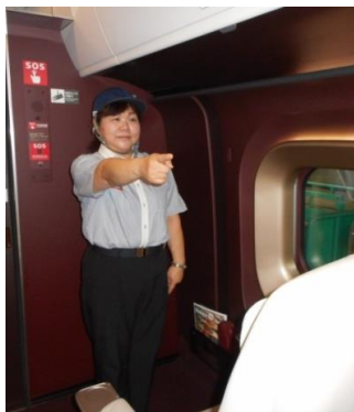
清掃後の指差確認