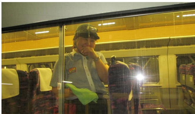
車窓の拭き掃除中、カメラを見つけたEさん