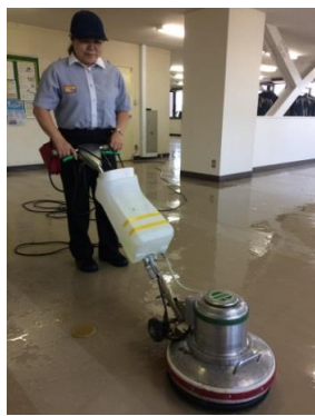
資格習得のための特訓中